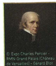
© Expo Charles Percier - RMN-Grand Palais | Château de Versailles - Gérard Blot

Ébloui par l'Italie de la Renaissance, Charles Percier a profondément contribué à redéfinir les pratiques artistiques dans de nombreux domaines de l'architecture au décor, du mobilier à l'ornement. L'exposition met en lumière cette intervention dans les arts qui contribua de façon décisive à ouvrir les voies du 19 e siècle et de la modernité.